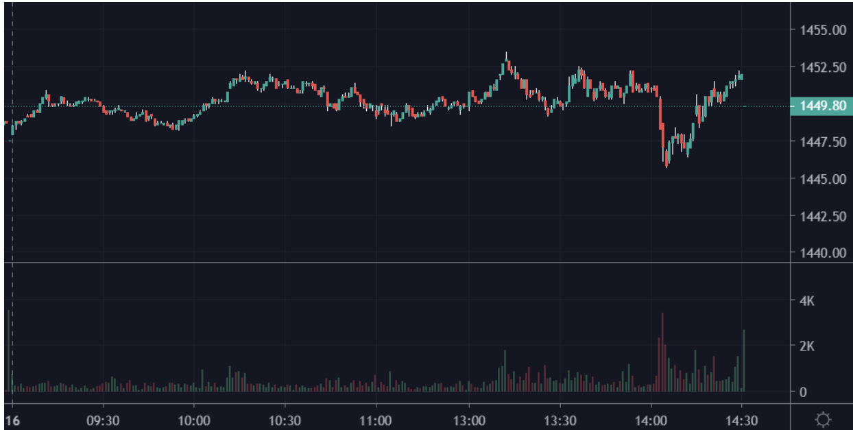
Đồ thị trong phiên VN30F1M.

Hiện VN30 đang ở trong xu thế hồi phục và tích lũy ngắn hạn. Tuy ngày hôm nay VN30, đóng cửa ở trên ngưỡng MA50 ngày, nhưng với xung lực giá vẫn chưa được mạnh mẽ, kèm theo đó thanh khoản của nhóm vẫn ở dưới ngưỡng trung bình 20 ngày. Chúng tôi dự báo VN30 sẽ có thể biến động trong biên độ hẹp với kháng cự là đường MA50 ngày và hỗ trợ là đường MA100 ngày. Nếu có thể chinh phục được kháng cự tại MA50 ngày cùng với thanh khoản cải thiện thì VN30-Index sẽ trở lại với xu thế tăng giá với mục tiêu gần nhất ở vùng đỉnh lịch sử 1540-1560 điểm. Ngược lại nếu không giữ được hỗ trợ MA100 ngày thì rủi ro giảm điểm sẽ lại tăng cao.